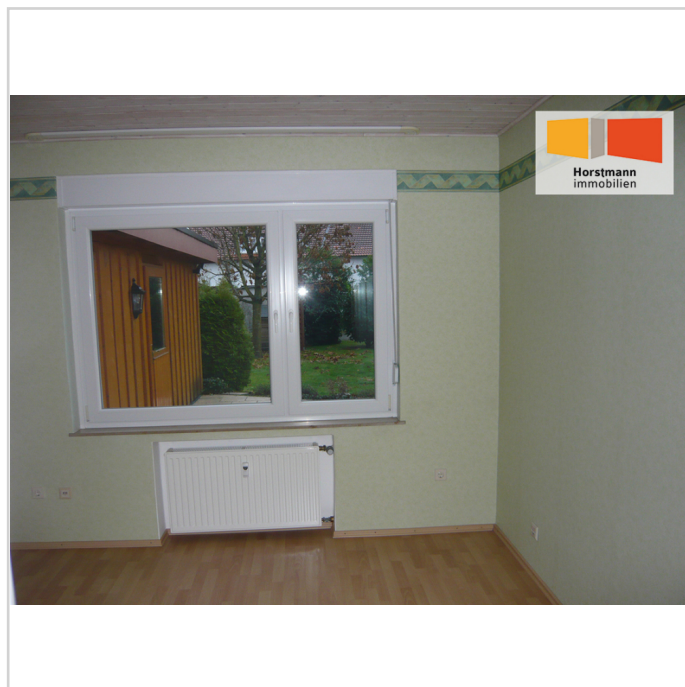
Büro- oder Gästezimmer