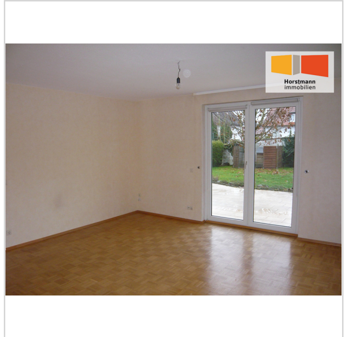
Wohnzimmer mit Terrassentür