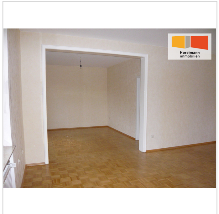
Blick ins Esszimmer