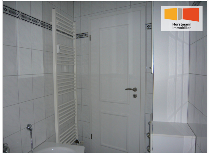
... und Badewanne