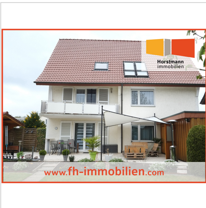
Terrasse mit Gartenhaus

Zimmer: 3,00 Wohnfläche ca.: 81,00 m 2 Kaltmiete: 645,00 EUR (zzgl. Nebenkosten)