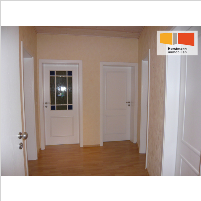
Flur - links das Wohnzimmer

Zimmer: 3,00 Wohnfläche ca.: 81,00 m 2 Kaltmiete: 645,00 EUR (zzgl. Nebenkosten)