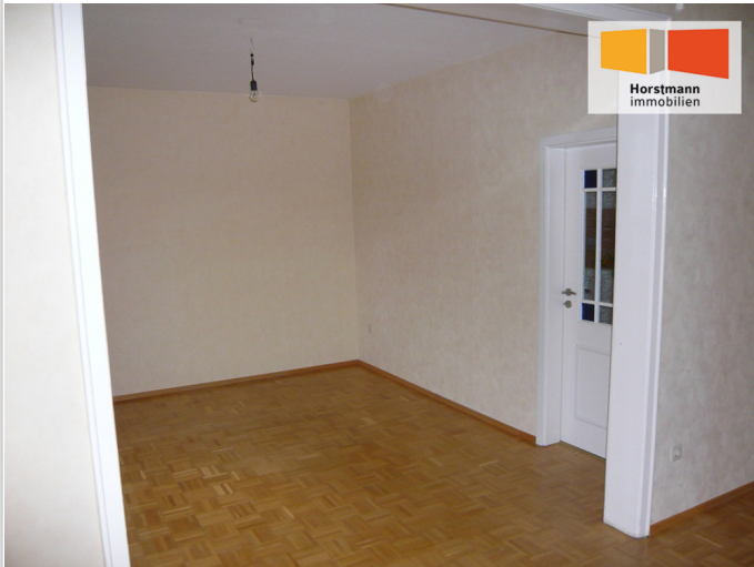
Esszimmer + rechts die Küche

Zimmer: 3,00 Wohnfläche ca.: 81,00 m 2 Kaltmiete: 645,00 EUR (zzgl. Nebenkosten)