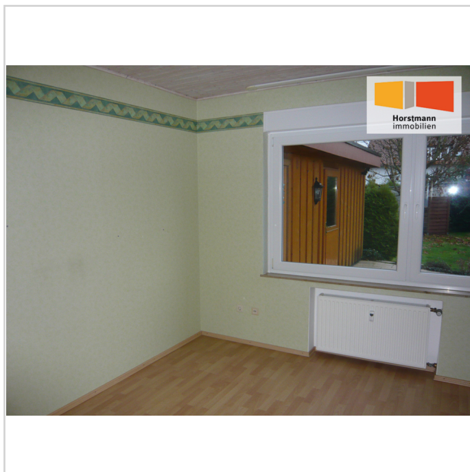
Büro- oder Gästezimmer

Zimmer: 3,00 Wohnfläche ca.: 81,00 m 2 Kaltmiete: 645,00 EUR (zzgl. Nebenkosten)