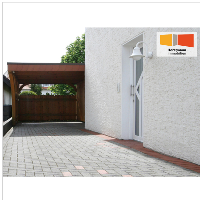
Hauseingang mit Carport