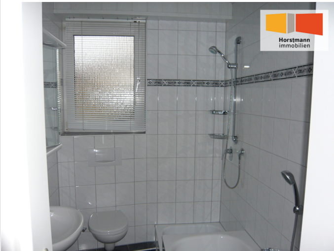
... mit Dusche ...